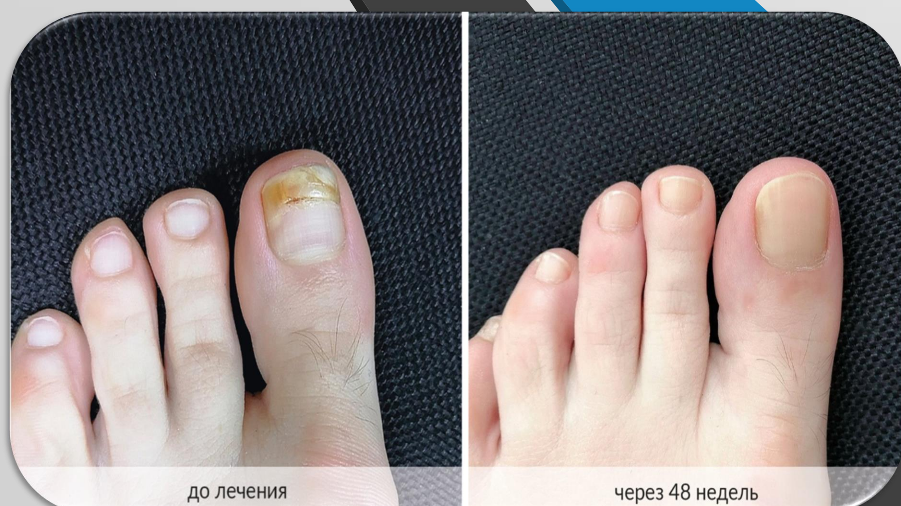
Рис 1. Результат через 48 недель лечения